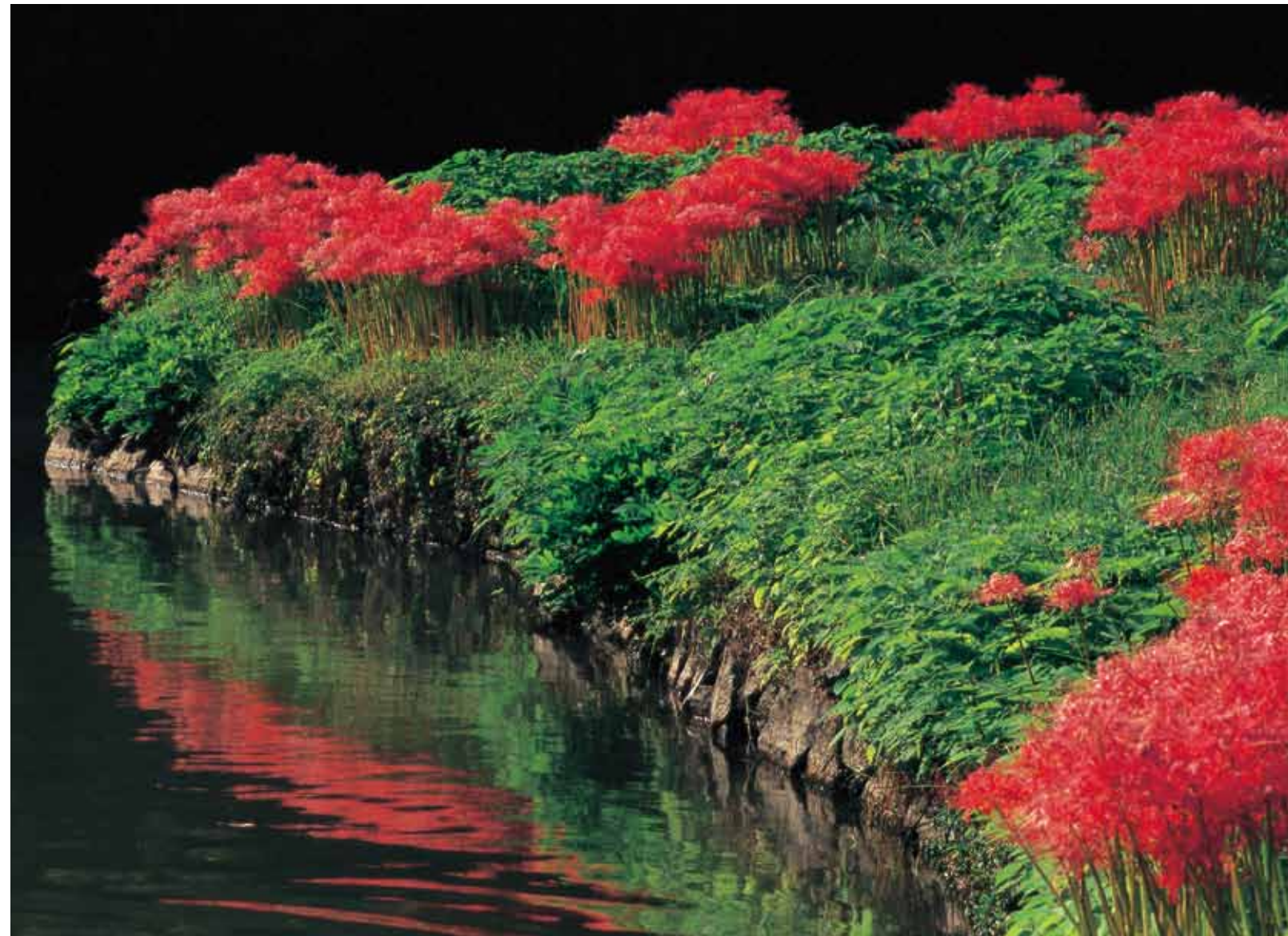
曼珠沙華 陽を浴びる水辺の彼岸花（岡山市近水園）