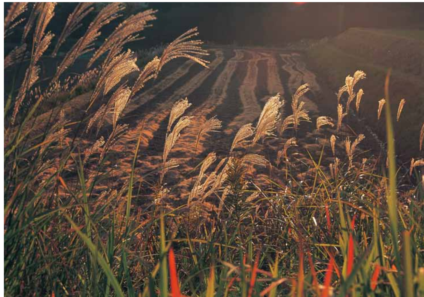
静かな秋 夕陽がすすきの穂を照らして里山の一日が終わる（赤磐市竜天）