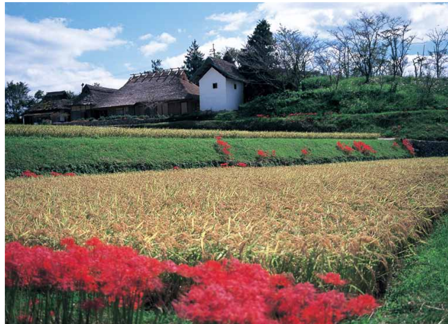
山里の秋 鮮やかな彼岸花に縁どられた実りの田 （備前市八塔寺）